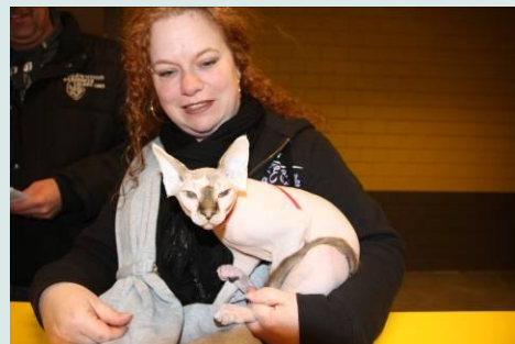
Trotse eigenaar met kampioen?

Er zijn ook enkele kramen aanwezig waar allerlei verschillen kattenbenodigdheden aangeschaft kunnen worden. Denk zoal aan kattenspeeltjes, krabpalen, mandjes, slaapkussentjes e.d. Daarnaast geven dealers ook advies geven op gebied van verzorging en voedsel voor uw katten. Felikat (Nederlandse vereniging van fokkers en liefhebbers van katten) werd in 1934 te Rotterdam opgericht en is de oudste kattenvereniging in Nederland.