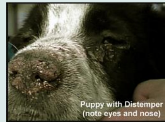
Puppy met hondenziekte

Gelukkig komt hondenziekte dankzij vaccinaties bijna niet meer voor.