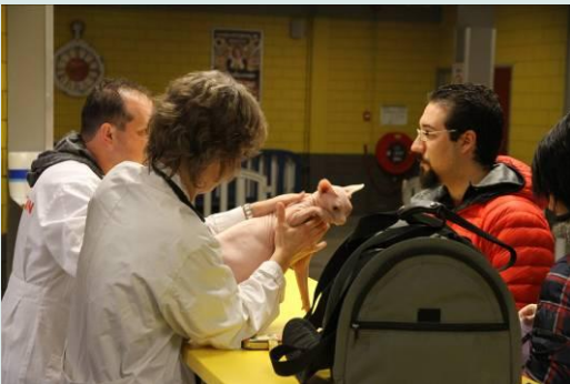
Collega dierenarts keurt een kat

Op zondag 11 januari 2015 mocht ik weer katten keuren op de internationale kattenshow van Nederlands oudste kattenvereniging "Felikat". Voor kattenliefhebbers is dit gebeuren een waar paradijs.