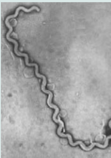
Leptospira bacterie (veroorzaakt ziekte van Weil).

De ziekte van Weil, ook wel Leptospirose genoemd is een infectieziekte veroorzaakt door een bacterie. Besmetting vindt plaats via urine van besmette dieren of urine van bruine ratten. De ziekte van Weil is ook besmettelijk voor mensen. Onder andere aantasting van de lever, nieren en bloedvaten wordt veroorzaakt door deze bacterie. Helaas zijn er vele varianten van de bacterie, en de enting kan slechts tegen enkele varianten bescherming bieden.