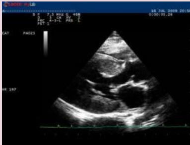
Echo worden gemaakt door dierenarts-specialist Warmerdam in Noordwijkerhout

Met behulp van een electrocardiogram (ECG) kunnen hartritmestoornissen gekarakteriseerd worden. Röntgenfoto's van de borstkas dienen om de aanwezigheid van vocht in longen en borstkas vast te stellen.