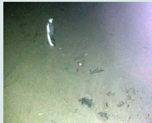
Ziet u hem? Wij niet.