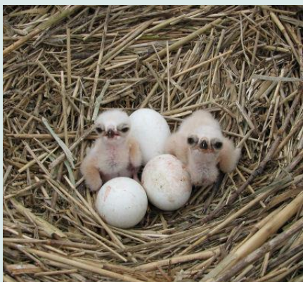
Nest van een roofvogel

Voor het najaar een nieuwe quiz (2 deelvragen):