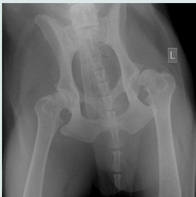
Ook op deze foto vooral slechte aansluiting te zien van de linker heup.

Er is dus ernstige artrose te zien van de heupen aan beide kanten. De hond krijgt nu pijnstillers en loopt nu aanzienlijk beter. Genezing is niet echt mogelijk. Wel verlichting. Ook voedingssupplementen kunnen een enkele keer bijdragen aan de vermindering van de klachten.