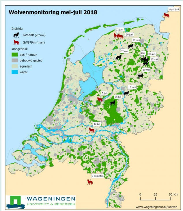
Kaart: Wageningen Environmental Research