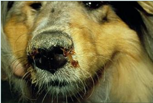
Hond met ziekte van Carré

luchtwegproblemen, maag-darmklachten, neurologische problemen of last van bijvoorbeeld de ogen zijn.