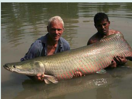
Arapaima (die weer vrijgelaten wordt)

Deze passagier is inmiddels veroordeeld tot zes maanden gevangenisstraf waarvan drie maanden voorwaardelijk met een proeftijd van twee jaar. Ook zijn er meerdere orchideeën, een aantal producten van beschermde houtsoorten en 40 kilo poeder van slangenhout in beslag genomen. Ook vonden de inspecteurs medicijnen met ingrediënten van beren, een ijsberenvel, een aantal levende vogels en 120 arapaimavissen.