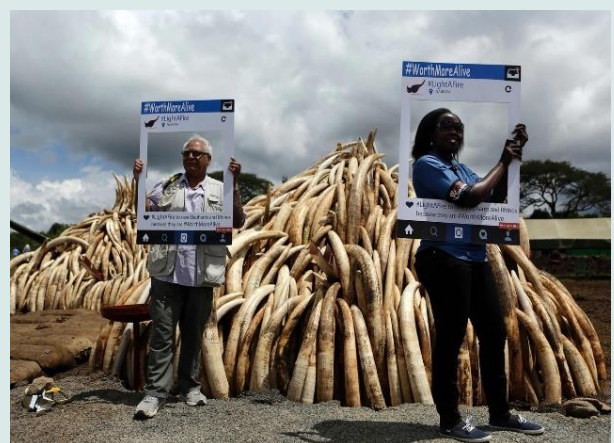
Levend meer waard!!

De Europese Unie heeft daarom het Action Plan against Wildlife Trafficking 2016-2020 uitgebracht waar ook Nederland zich aan committeert. Het gezamenlijk optreden (Operatie Pangolin) komt bovenop de reguliere acties die het hele jaar door blijven plaats vinden. Ook de komende jaren zullen er gerichte acties plaatsvinden.