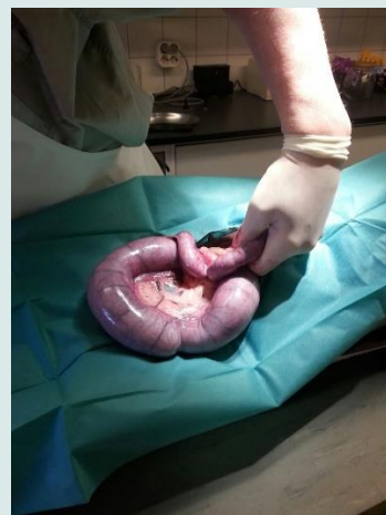
Baarmoeder van ons hondje. Normaal heeft de baarmoeder maximaal de dikte van een pen!

Een enorme baarmoeder, die normaal de dikte van een balpen moet hebben.