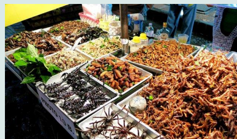
Markt in Thailand met van alles wat eetbaar is

Ook bijzonder waren potten en ketels met larven van ik weet niet waarvan, gedroogde krekels, kakkerlakken etc.