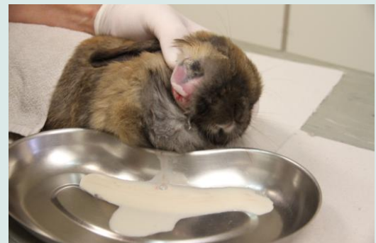
Abces is geopend en de pus wordt opgevangen

Antibiotica kunnen bijna niet doordringen in abscessen door de slechte doorbloeding.