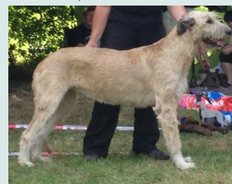
Papa Irish Coffee vom Apletal