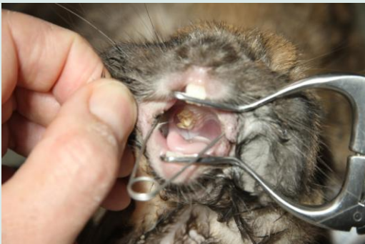
Het gebit wordt in orde gemaakt

Bij konijnen is het enige symptoom vaak een zwelling. De dieren eten meestal goed, zijn niet sloom, hebben geen koorts en het abces lijkt ook niet erg pijnlijk.