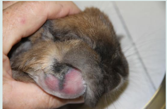
Of de foto zie je de duidelijke zwelling

Een abces is een lokale ophoping van pus in een holte in het weefsel.