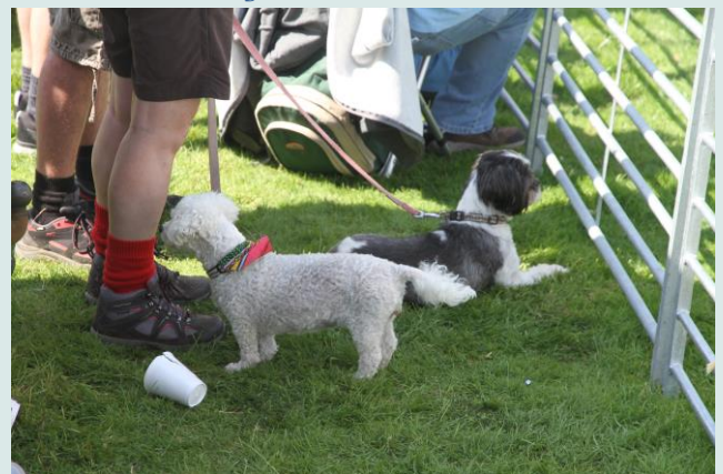
De een z'n hobby is de andere nog niet

Al met al een prachtige vakantie gehad en zeker een aanbeveling om met de hond, na een goede voorbereiding uiteraard een keer naar toe te gaan.