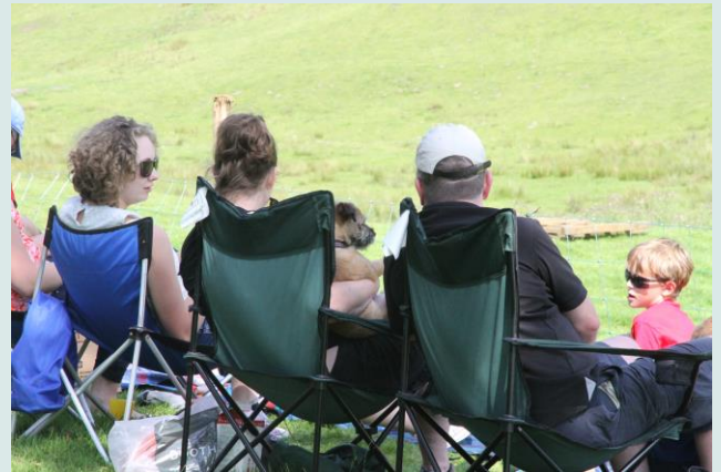
Toeschouwers op schoot