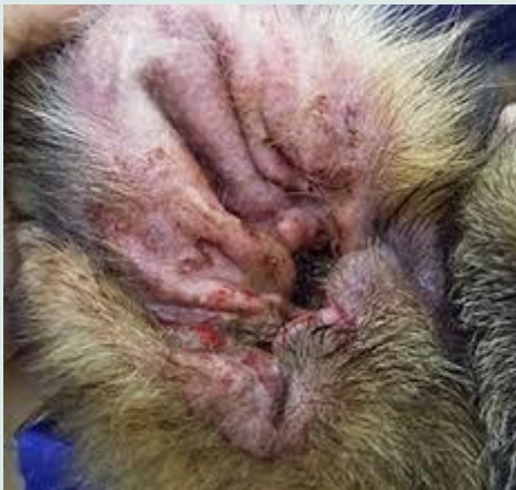
Ontstoken oorschelp, vaak bij allergieën.