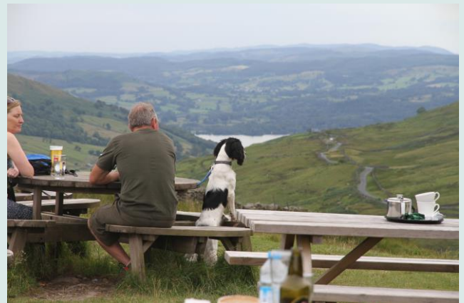
Samen genieten van het uitzicht