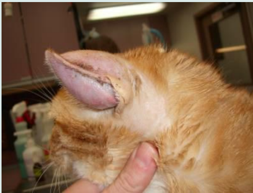
Othematoom bij de kat

Door al dat vele schudden en krabben ontstaat een enkele keer een othematoom (bloedoor). Dit is een zwelling van de oorschelp door een onderhuidse bloeditstorting.