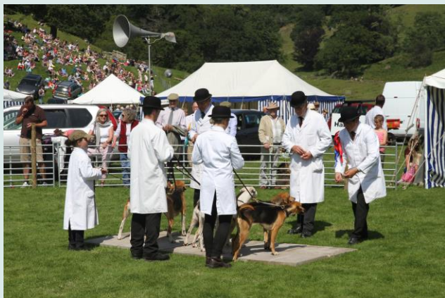
De keuringen van de verschillende rassen op z'n Brits.