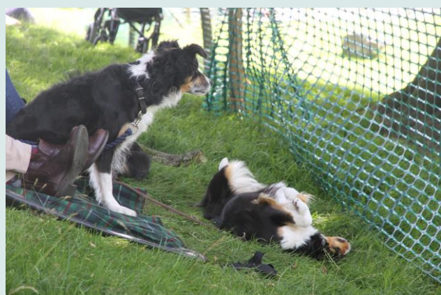
Je hebt ook bij Border Collies de werkers en de luijaards..Hier kijken ze hoe goed hun collega de schapen naar de goede plek toe drijft (niet alle schapen waren heel willig)