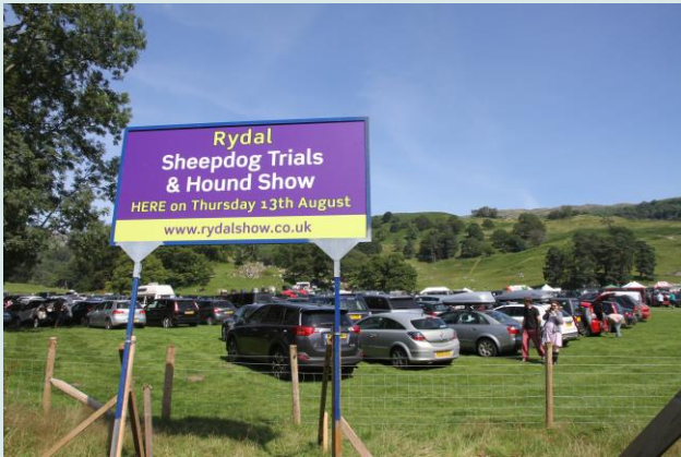
Border Collie trials in lake district.