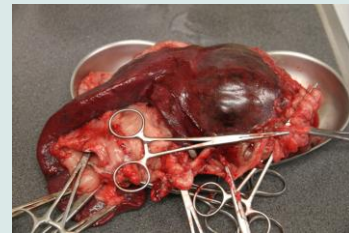
Links op de foto nog en stuk normale milt, rechts de tumor, 1,2 kg.

Als deze NB verschijnt zijn de hechtingen net verwijderd.