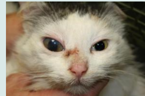
Glaucoom secundair aan ontsteking in het (R) oog (uveïtis)

Vaak zijn honden/katten met glaucoom lichtschuw. Ook zien we soms rode oogleden. Indien het snel ontstaat, valt ook vaak een blauwige waas over het gehele oog op.