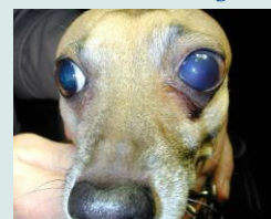
Beiderzijds glaucoom bij een hondje

Glaucoom (zgn. groene staar) betekent een verhoogde druk in de oogbol. Glaucoom komt zeker niet alleen bij oudere dieren voor, ook jonge dieren kunnen deze aandoening krijgen.