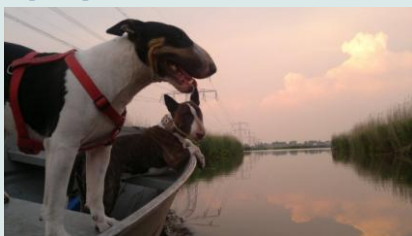
Honden kijken al naar het beloofde land

„Onze hoogste prioriteit is te voorkomen dat meer honden op zee sterven. We zullen onze aanwezigheid op zee vergroten, strijden tegen de hondenhandelaars, illegale importstromen voorkomen en interne solidariteit versterken”, aldus het akkoord. (Daarbij zou de EU pogingen in het werk stellen om de regering in Libië weer de macht terug te geven.)